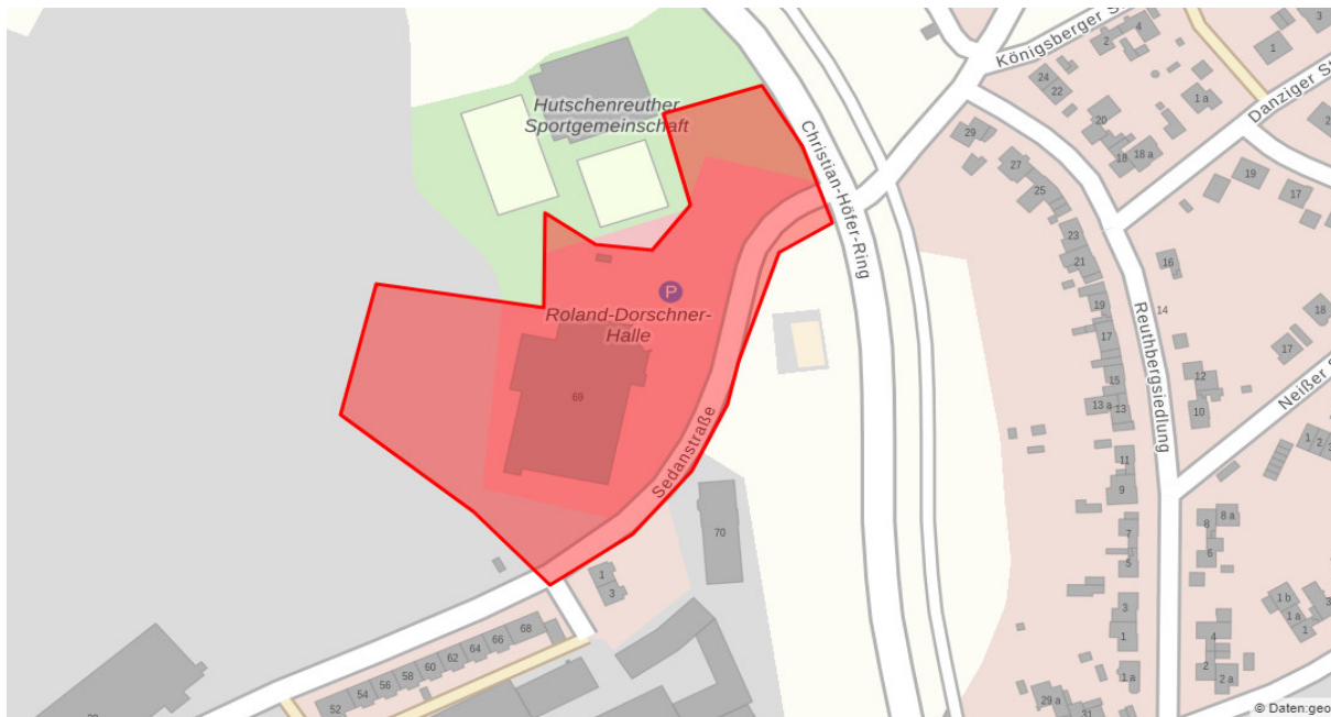
Diese Anlage ist Bestandteil der Allgemeinverfügung des Landratsamtes Wunsiedel i. Fichtelgebirge, Az. 31-5304-Teststellen, vom 12.02.2021